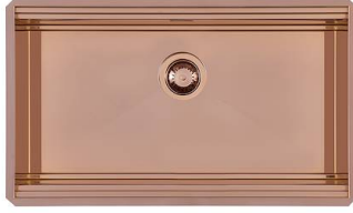
RIVA 750 COPPER SOUS PLAN N034 S58